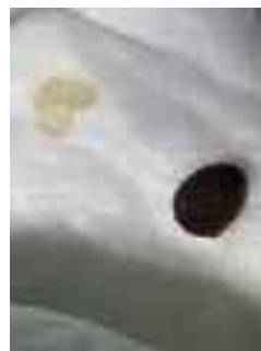
Figura 4. Primi pelletts fecali e prime gocce di urina

In questo caso è stato somministrato sulla base dei sintomi fisici e mentali.