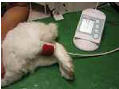
Figura 2. Misurazione della pressione con il metodo oscillometrico. Nel coniglio i valori diastolici registrati non sempre sono attendibili.

All'esame clinico ed alla palpazione addominale si riscontrò una stasi completa del cieco e del colon (consistenza eccessivamente pastosa), non si osservò diarrea, ma neppure si trovarono tracce di pelletts fecali nel trasportino né di urine. L'animale mostrò polipnea con respiro superficiale ed evidente movimento delle ali del naso, la temperatura corporea era 39°, l'ano era beante ed il riflesso perineale era assente. La coniglia inoltre era immobile ed aveva sguardo fisso, midriasi, notevole algia addominale alla palpazione, mentre alla auscultazione non si rilevò