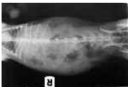
Figura 5. Radiogramma in proiezione ventro-dorsale.

Le proiezioni radiografiche di controllo nelle proiezioni ventro-dorsale e latero-laterale evidenziarono l'inizio dell'effetto di gelsemium: il cieco contratto ed il colon con la parete non più distesa con notevole riduzione dei gas (Figure 5 e 6).