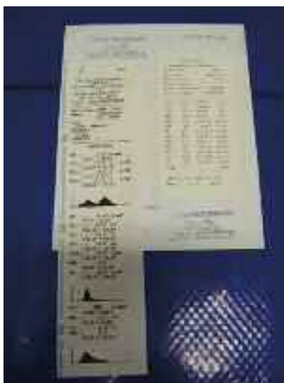
Figura 7. Esame ematobiochimico ed emocromocitometrico.

Gli esami del sangue confermarono l'iniziale stato endotossico, consentendo di emettere diagnosi di enteropatia mucoide in fase risolutiva (Figura 7).