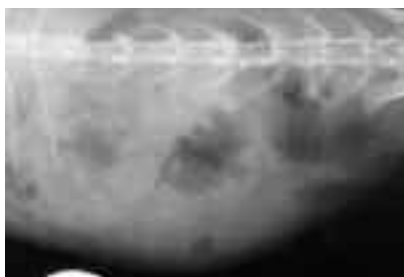
Figura 6. Particolare del cieco che in lastra appare contratto sotto l'effetto di Gelsemium sempervirens .

Gli esami del sangue confermarono l'iniziale stato endotossico, consentendo di emettere diagnosi di enteropatia mucoide in fase risolutiva (Figura 7).