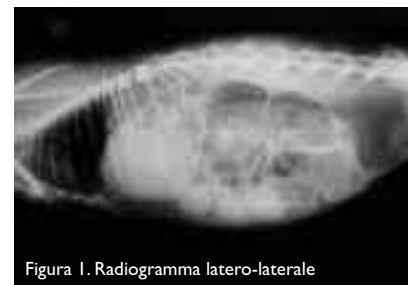
Figura 1. Radiogramma latero-laterale

Una coniglia di tre anni di età e sterilizzata un anno prima, viene portata all'esame clinico urgente dopo essere stata visitata il giorno precedente da un collega e ad esso portata per disoressia associata a diminuzione quantitativa e della dimensione dei pellets fecali (normalmente di circa 1 cm di diametro). Il collega eseguì una radiografia "total body" in proiezione latero-laterale (Figura 1).