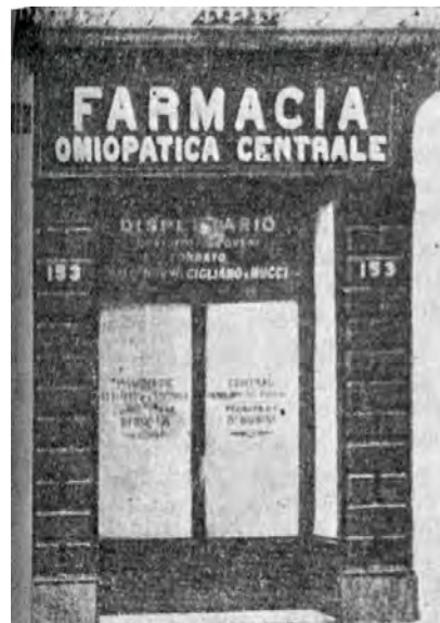
Fig. 4. Farmacia Omeopatica Centrale di Via Chiaia, Napoli.

Nell'epidemia seguente, del 1865, le cose cambiano. Sotto il nuovo Regno d'Italia gli allopati tornano all'assalto. Quelle che erano critiche limitate e naturali da parte di chi si vedeva defraudato dalla medicina che aveva praticato tutta la vita, diventano aggressioni, sostenute da un'amministrazione che mostra su questo argomento debolezza, se non ostilità. Rubini deve dimettersi dall'incarico di eccellenza di direttore dell'ospedale per colerosi di Foggia per gli attacchi dei medici tradizionali e l'insufficiente difesa da parte della direzione dell'ospedale. A Napoli gli omeopati praticanti sono ridotti a 183 e la giunta municipale impedisce loro di curare i colerosi sostenendo che non sono in possesso di un Regio Decreto. Negli anni '70 in tutta Italia rimarranno a praticare l'omeopatia solo 6 o 7 famiglie, come i Cigliano a Napoli e i Mattoli a Perugia. Le nuove scoperte in campo medico, da Jenner a Pasteur, finiscono per mettere in ginocchio l'omeopatia.