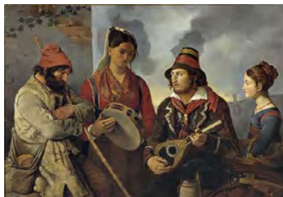
Fig. 1. Rövarer i Abruzzo di Hjalmar Mörner, inizio 1800, Museo Nazionale di Svezia.

È portato per la medicina. La studia all'università di Napoli, si laurea in soli quattro anni, e nel 1825 viene nominato vice-protomedico della Provincia a Cellino. Nel frattempo l'omeopatia si diffonde e acquista credito negli ambienti scientifici della capitale, grazie