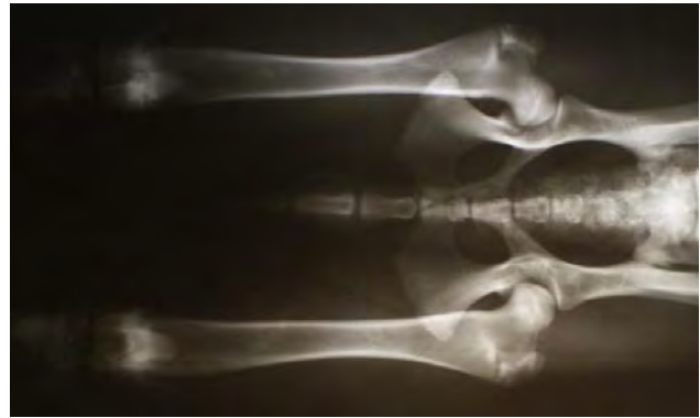
Fig. 1. Displasia anche

Sereno e gioviale, andatura più potente, addirittura salta spontaneamente il muretto di 60 cm di fronte allo studio, alla manipolazione dell'anca dx si lamenta ancora. Arg-phos 3 LM BID per 14 gg