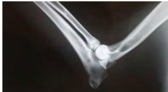
Fig. 3. Gomito sx