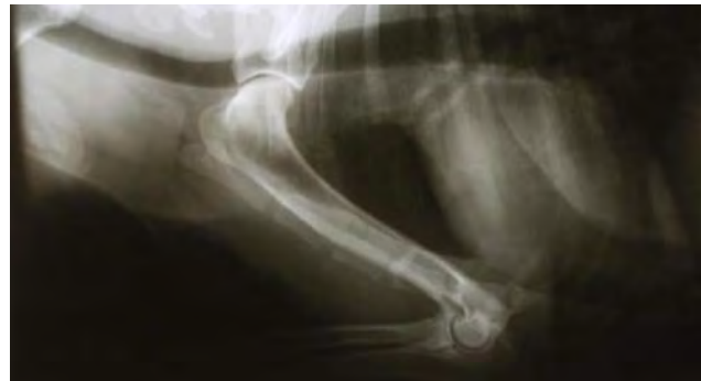
Fig. 4. Displasia spalla dx