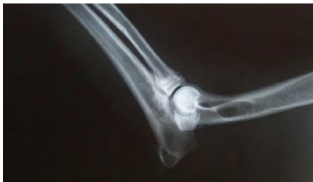
Fig. 7. Gomito dx