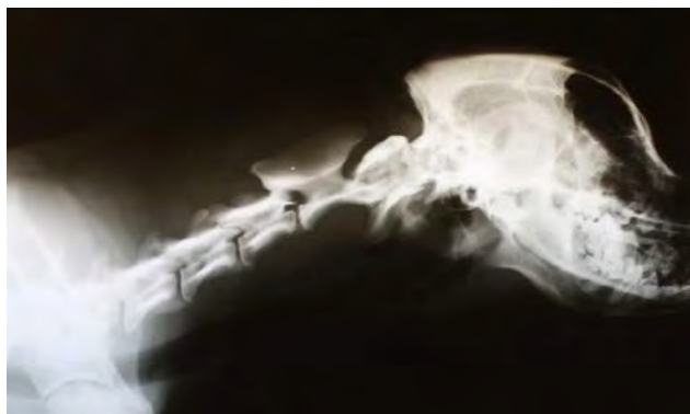
Fig. 5. Vertebre cervicali