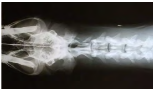
Fig. 6. Vertebre cervicali proiezione sagittale