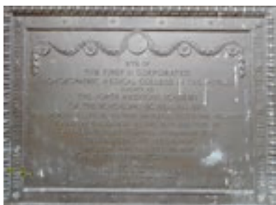
Questa targa commemorativa è ciò che rimane della prima scuola ufficiale di Omeopatia al mondo: nessun edificio, solo una targa in una strada e davanti a un palazzo di nuova costruzione.