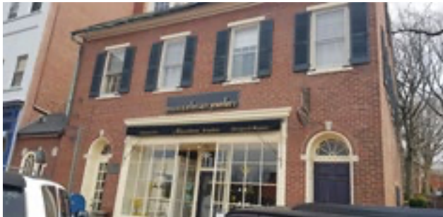
La sede della farmacia Freitag