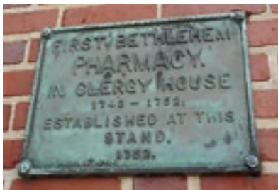
Targa della Vecchia Farmacia