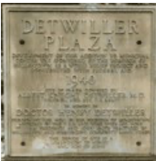
Easton, la targa commemorativa nella piazza a lui intitolata, Detwiller Plaza.

Nel 1844 contribuì alla fondazione dell' American Institute of Homoeopathy a New York e ne rimase membro fino alla morte. Nel 1866 partecipò alla fondazione della Homoeopathic Medical Society dello Stato della Pennsylvania.