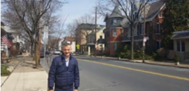
Hellertown con numerose case d'epoca