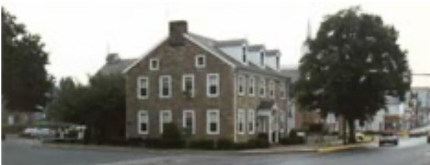
La sua casa di Easton

Da allora fino alla morte, fu studioso, praticante e strenuo sostenitore dei principi dell'Omeopatia. Nel 1836 visitò la sua terra natale con il figlio maggiore, William. In Europa conobbe numerosi studiosi, tra cui i professori Schoenlein, Oken e Shintz. Ebbe anche diversi incontri con Hahnemann a Parigi, per promuovere l'Omeopatia negli Stati Uniti e in particolare l'Accademia di Allentown, allora appena fondata. Nel 1853 si trasferì a Easton, dove visse fino alla morte.