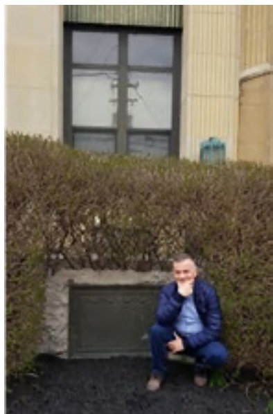
Vicino alla targa della vecchia Accademia di Allentown