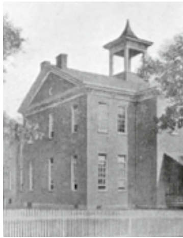
Scuola di Omeopatia di Allentown, Pennsylvania.

tra la progettazione e la fondazione della Scuola, i quattro medici costituirono anche die Northampton Gesellschaft homoeopathischer Aertze (Società dei Medici Omeopati di Northampton) il 23 agosto 1834. Altri sei medici della Lehigh Valley e due pastori protestanti furono tra i soci fondatori di questa associazione, che aveva come scopo di