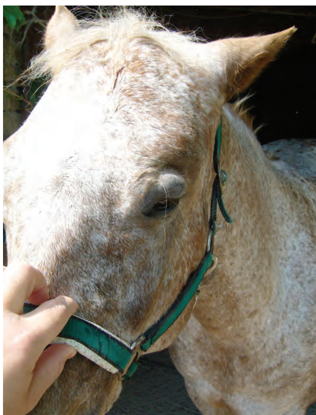
Fig 3. Edema palpebrale ed auricolare sx

Il proprietario afferma di averle trovato addosso diverse zecche; è risaputo che JUSTY risulti essere ipersensibile alle loro punture. Ad un esame ispettivo generale l'edema si diffonde anche a carico di zone più declivi, specie a livello inguinale in corrispondenza della linea mammaria con interessamento parziale sino alla regione perivulvare del lato dx