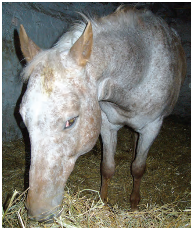
Fig 7. Risoluzione edema diffuso