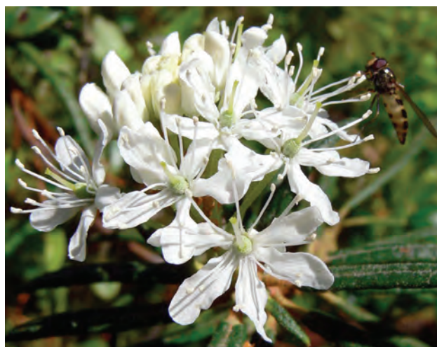
Fig 8. Ledum palustre

Per l’attività del Medico Veterinario si rende necessario sfruttare al meglio il proprio bagaglio professionale e formativo, non per ultimo la conoscenza di quella semeiologia classica tradizionale quale elemento fondante per un approccio omeopatico. Nel caso della cavalla l’adozione