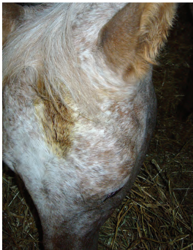
Fig 6. Ferita penetrante cicatrizzata

I progressi visivi di JUSTY saranno soddisfacenti e duraturi consentendo condizioni di vita dignitose anche all'aperto.