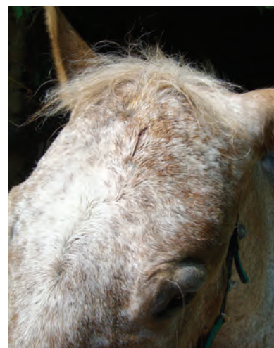
Fig. 1. Ferita da taglio sulla fronte

Ad un esame ispettivo della testa si evidenzia una ferita da taglio infetta a margini netti sulla fronte subito sopra l'arcata dell'occhio sx provocata da un chiodo arrugginito rinvenuto all'interno del box, probabilmente la cavalla a causa del suo deficit visivo non lo ha potuto evitare (Foto n. 1).